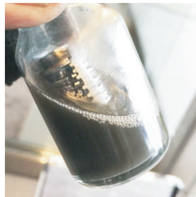
専門クリーナーにて洗浄

弊社では突然鍵が抜けなくなるなどの事故を未然に防ぐためにシリンダー（鍵穴）の定期的な洗浄・メンテナンスをお勧めしております。